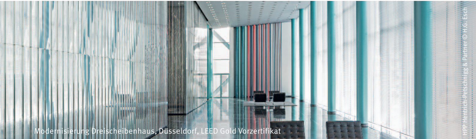
Modernisierung Dreischeibenhaus, Düsseldorf, LEED Gold Vorzertifikat

Zertifizierungssysteme wie das DGNB (Deutsches Gütesiegel für nachhaltiges Bauen), LEED (Leadership in Energy and Environmental Design) und BREEAM (Building Research Establishment Environmental Assessment Methodology) wurden mit dem Ziel entwickelt, Gebäude nach