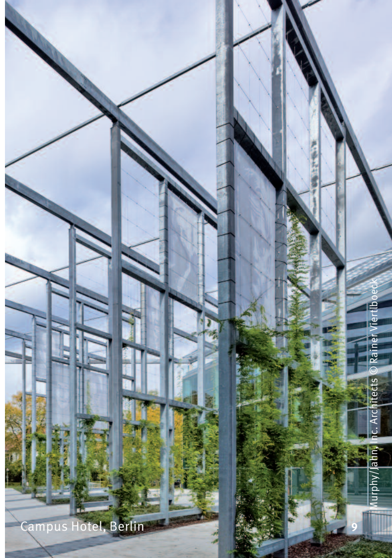
Campus Hotel, Berlin

Bei Stahlbauten ist selbst der Rückbau werthaltig . Am Lebensende des Gebäudes steht eine einfache Demontage mit Wiederverwendung oder Recycling – leicht lösbare Verbindungen machen es möglich.