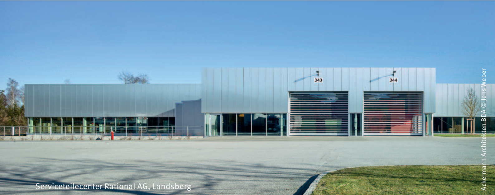
Serviceteilecenter Rational AG, Landsberg