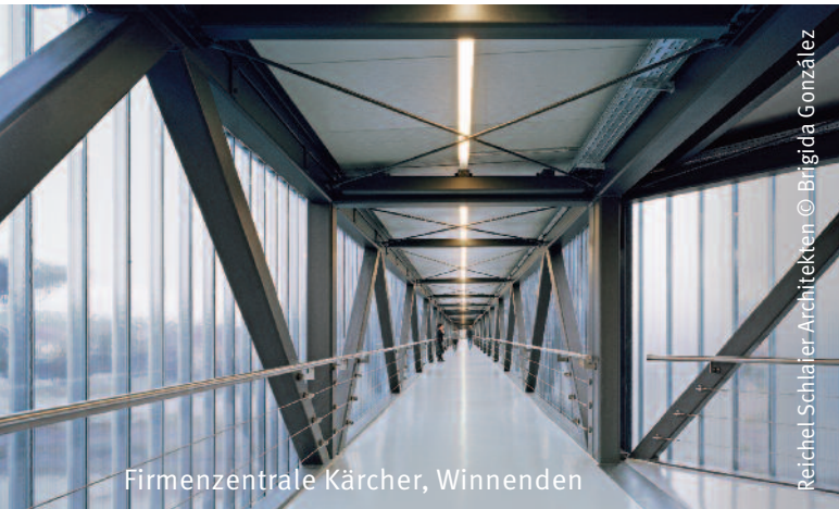
Firmenzentrale Kärcher, Winnenden

Reichel-Schlaier Architekten