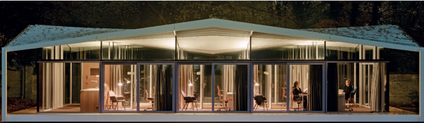
Fellows Pavilion American Academy, Berlin