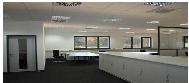
Bild 2: Integriertes Deckensystem mit verschiedenen Funktionselementen

Klima- und beleuchtungstechnische Einrichtungen werden in ein Schema gebracht, das dem Teilungsmodul der Deckenkonstruktion überlagert ist. Sie können daher – unabhängig von der jeweiligen aktuellen Nutzung – alle einzelnen Flächeneinheiten nach den gleichen funktionalen Ansprüchen versorgen.