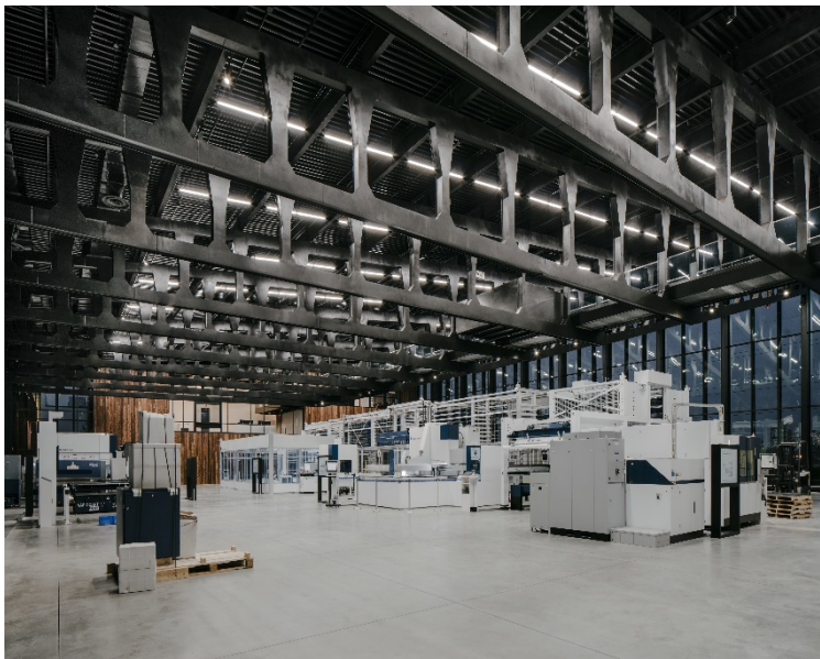
Gewinner des Preis des Deutschen Stahlbaues 2018: Trumpf Smart Factory – Chicago