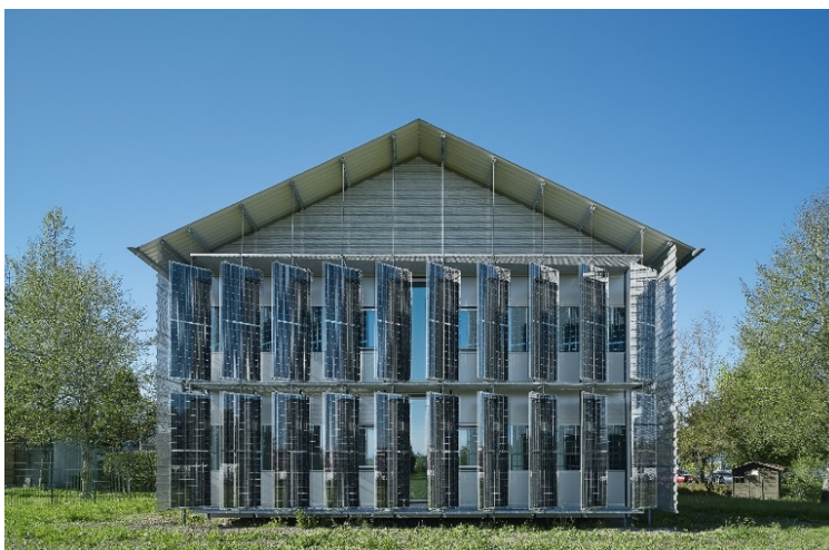
Gewinner des BMI Sonderpreises: Verkehrskommissariat Kißlegg Preise und Auszeichnungen 2018