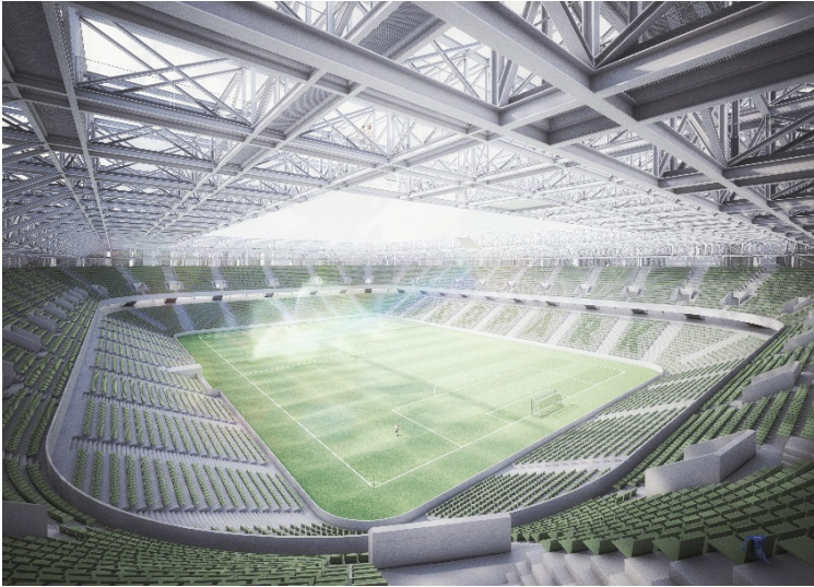
Gewinner des Förderpreises des Deutschen Stahlbaues 2018: Wohnen im Wildpark Stadion - Karlsruhe