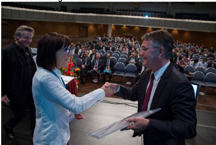
Staatssekretär Gunther Adler (rechts) übergibt den Sonderpreis des Bundesministeriums des Innern, für Bau und Heimat (BMI) beim Tag der Stahl.Architektur 2016.