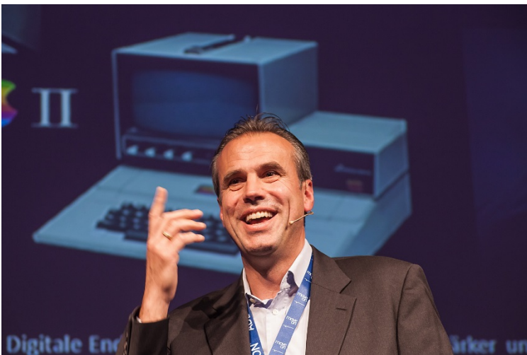
Ex-Google-Chef Christian Baudis.