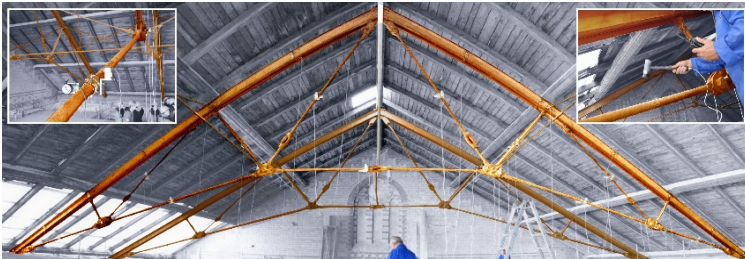
Gewinner des DAST-Forschungspreis 2018: Bestimmung des Beanspruchungszustands in fachwerkartigen Eisen- und Stahltragwerken

Das Bildmaterial darf kostenfrei unter Angabe des Copyright nur im Zusammenhang mit der Berichterstattung zum Thema dieser Presseinformation genutzt werden. Wir bitten um ein Belegexemplar.