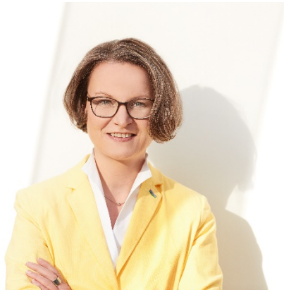
Ministerin Ina Scharrenbach.