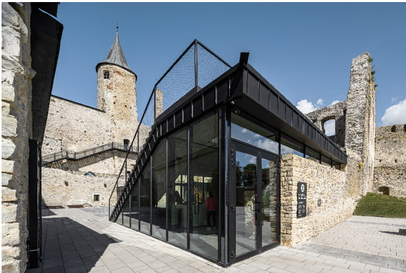
Projekt: Haapsalu Castle, Haapsalu/EST Vortragstitel: Orte zum Verweilen | Skulpturale Architektur in Stahl Referent: Margit Aule Büro: KAOS Architects, Tallinn/EST

bauforumstahl e.V. | Deutscher Stahlbau-Verband e.V. Sohnstraße 65 | 40237 Düsseldorf Fon 0211.54012.080 sekretariat@bauforumstahl.de www.bauforumstahl.de Vereinssitz: Düsseldorf; AG Düsseldorf, VR 8508 | VR 8439