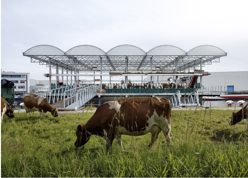
Projekt: Floating Farm | Agrarinseln mit Stahl, Rotterdam/NL Vortragstitel: Floating Farms | Agrarinseln mit Stahl Referent: Stahl Wesley Leeman Büro: GOLDSMITH Architects, Rotterdam/NL