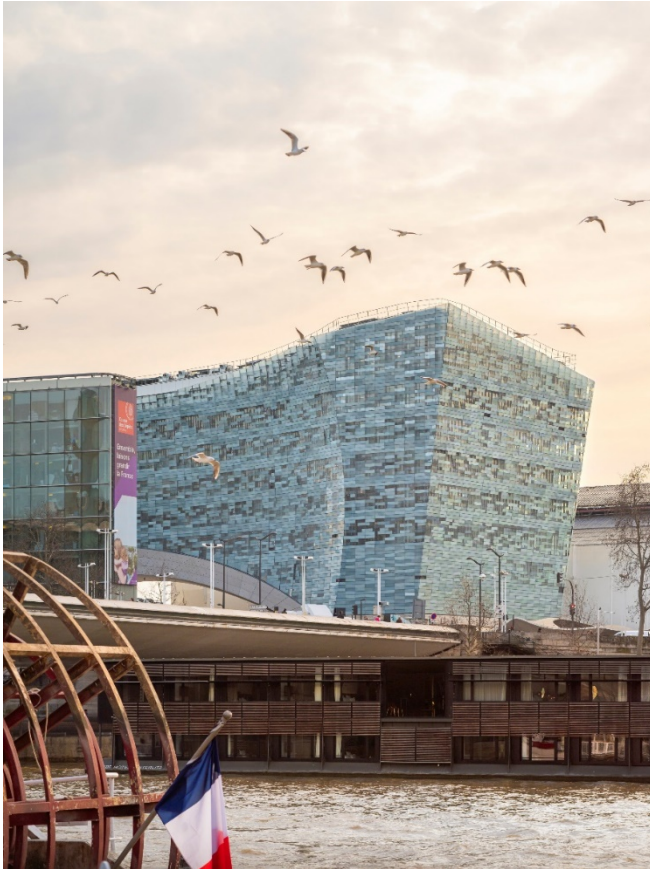
Projekt: Le Monde Headquarter, Paris/F Vortragstitel: Maßstäblich und präzise | Urbane Arbeitswelten mit Stahl Referent: Jette Hopp Büro: Snøhetta, Oslo/N