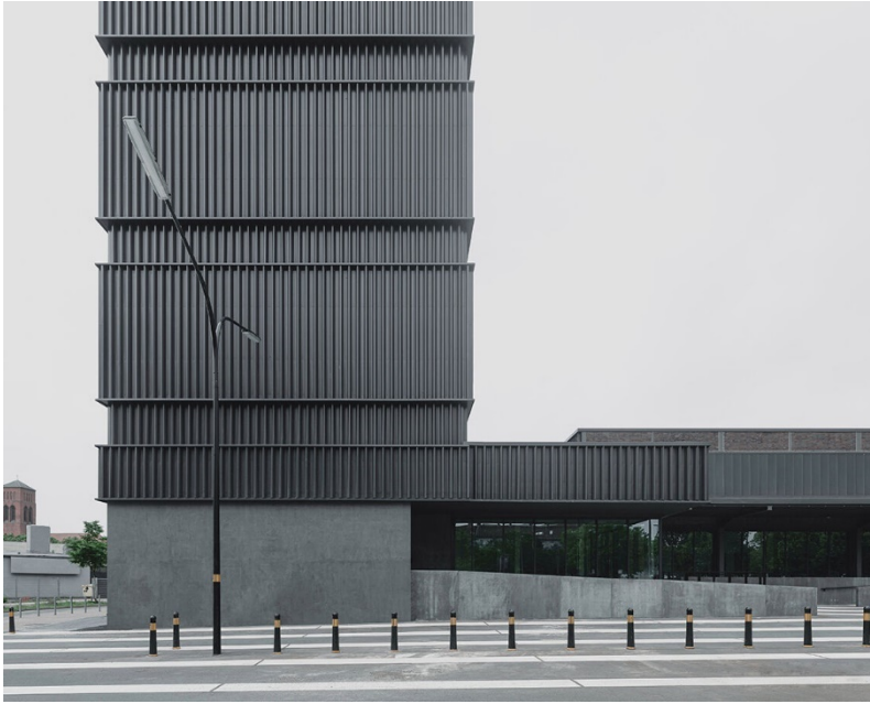
Projekt: Hochhaus am Güterbahnhof, Hannover/D Vortragstitel: Qualitäten weiterentwickeln - Bauen mit Stahl im Bestand Referent: Martin Fröhlich Büro: AFF Architekten, Berlin/D