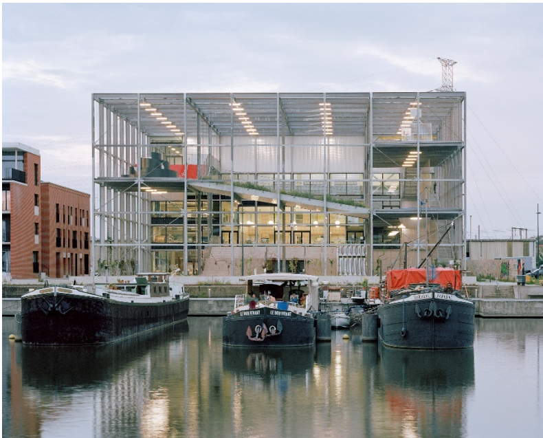
Projekt: Melopee Schule, Gent, Belgien Vortragstitel: Offen und lichtdurchflutet | Gestalterische Vielfalt mit Stahl Referent: Xaveer De Geyter Büro: XDGA Xaveer De Geyter Architects