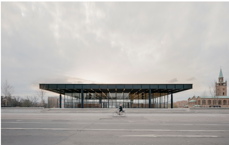
Projekt: Die sanierte Neue Nationalgalerie in Berlin/D Vortragstitel: Stählerne Moderne | Wiedereröffnung der Neuen Nationalgalerie“ Referent: Daniel Wendler Büro: David Chipperfield Architects, Berlin/D