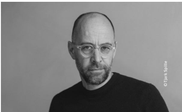
Martin Fröhlich, AFF Architekten.