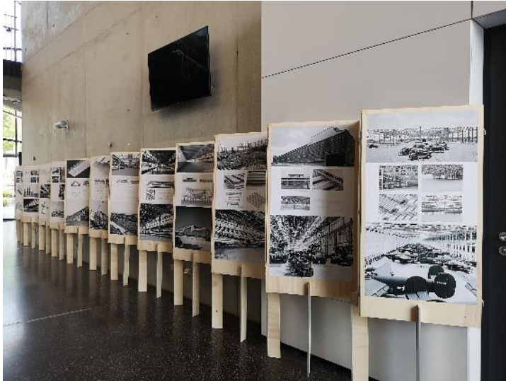
Ausstellung Albert Kahn

Mitglieder: Unternehmen: AG der Dillinger Hüttenwerke, ArcelorMittal Commercial Long Deutschland GmbH, Peiner Träger GmbH, Salzgitter Mannesmann Stahlhandel GmbH, Stahlwerk Thüringen GmbH; Verbände: Deutscher Stahlbau-Verband DSTV, Industrieverband Feuerverzinken e. V., Interessengemeinschaft Stahl-Brandschutzbeschichtung IGSB