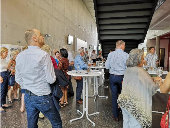
Ausstellungseröffnung Albert Kahn

Das Bildmaterial darf kostenfrei unter Angabe des Copyright nur im Zusammenhang mit der Berichterstattung zum Thema dieser Presseinformation genutzt werden. Wir bitten um ein Belegexemplar.