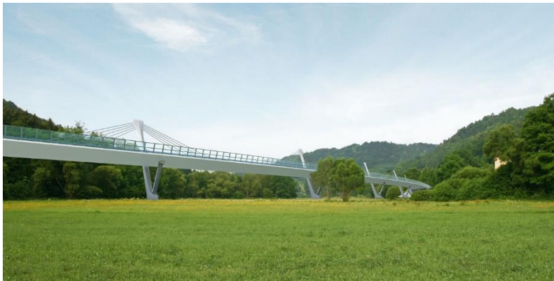
Talbrücke über die Schorgast.