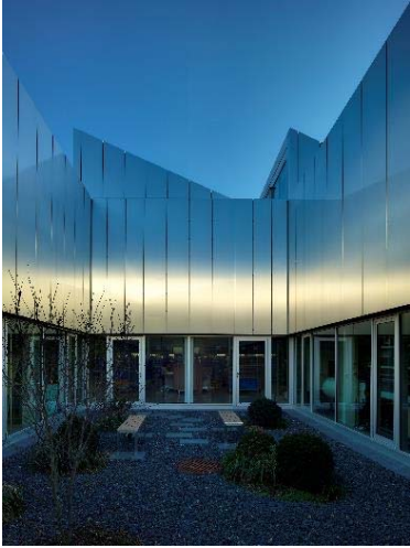
Gewinner Preis des Deutschen Stahlbaues 2016: Serviceteilecenter Rational Landsberg am Lech